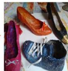
Création d'une chaussure en papier